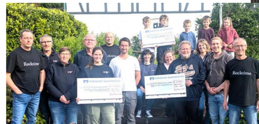
Die Spendeneempfänger: Förderverein Kindergarten, Helfer vor Ort im oberen Hundental und Bad am Rothaarsteig

Am 11. April fand die Rocktime in Oberhundem statt. Rund 350 Leute fanden den Weg in die Dorfgemeinschaftshalle, damit wurden unsere Erwartungen übertroffen. Im Spätsommer 2025 entstand die Idee, nach 24 Jahren nochmal eine Rocktime zu veranstalten. Innerhalb kurzer Zeit waren ein paar WhatsApp-Anfragen abgesetzt und das Orgateam stand fest. Zusammen mit den Helfern am Veranstaltungabend wurde es dann eine rundum gelungene Party. Über den Erlös von 5000 EUR konnten sich drei Institutionen in Form einer Spende freuen.