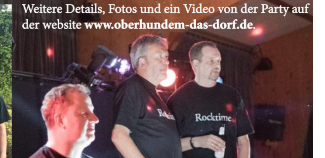
Weitere Details, Fotos und ein Video von der Party auf der website www.oberhundem-das-dorf.de .