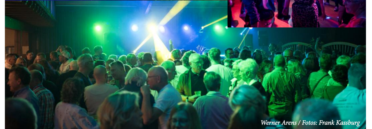
Werner Arens