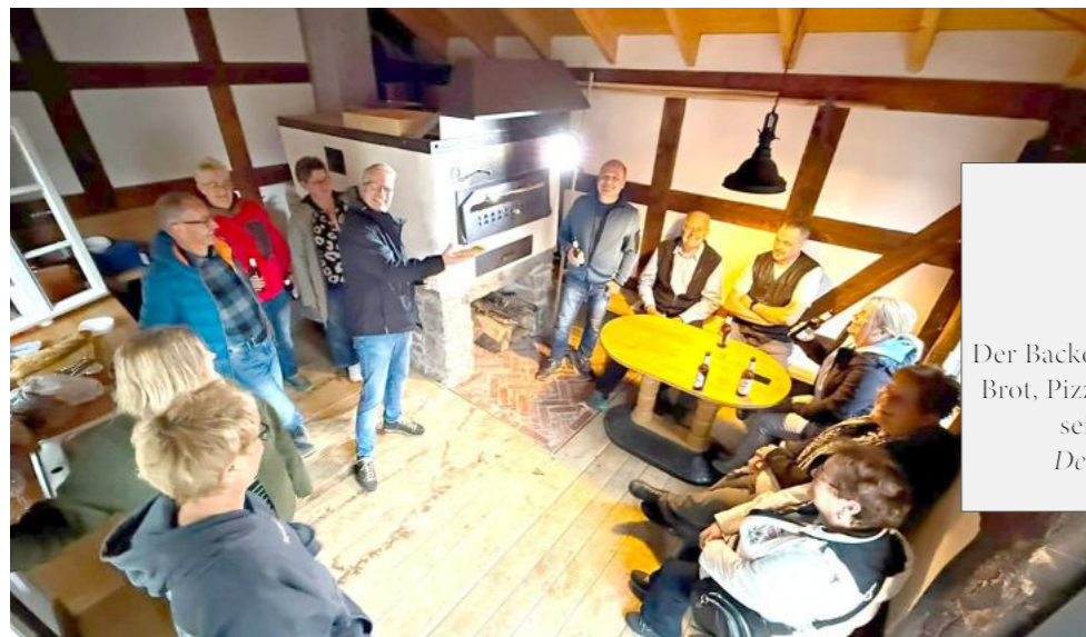
Gemütlicher Abend im Backes

Interessierte können sich bei Fragen oder für weitere Informationen jederzeit an die bekannten Vorstandsmitglieder wenden. (Jürgen Schmidt)