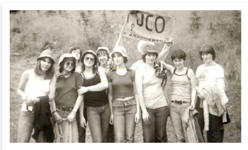
„JCO“ 2. Preis