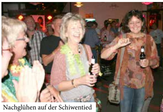
Nachglühen auf der Schiwentied