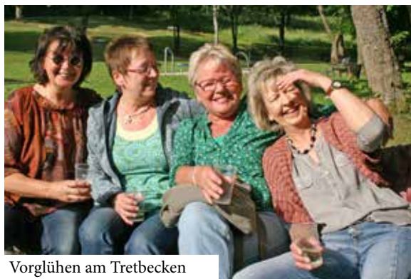
Vorglühen am Tretbecken