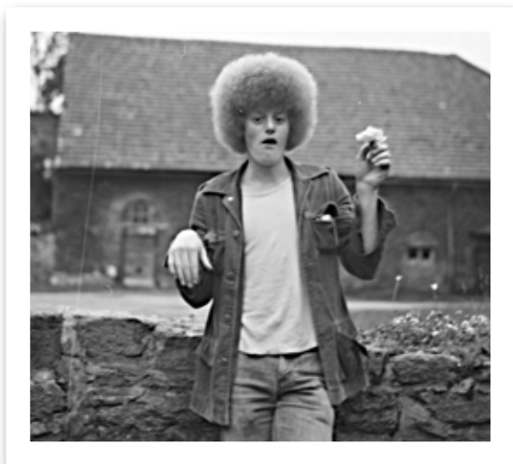
„Locke“ 1. Preis